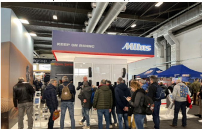
Motor Bike Expo (Verona, Włochy)