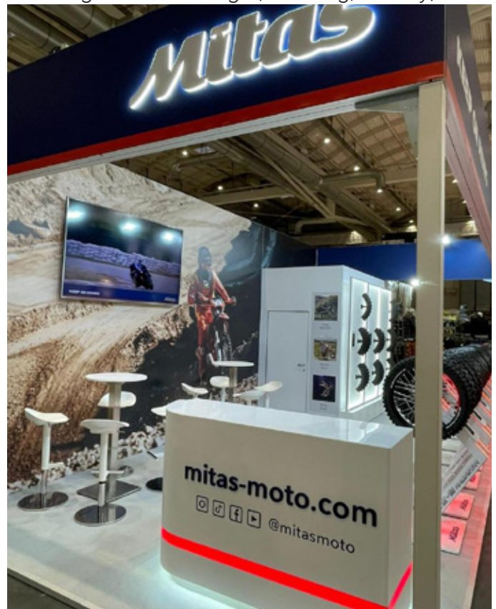
Hamburger Motorrad Tage (Hamburg, Niemcy)